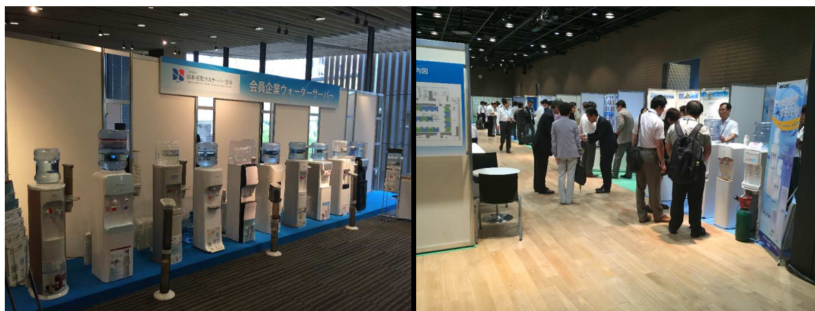
《第3回 宅配水業界交流展の開催風景》

そしてこの度、業界関係各社が一堂に会する国内唯一の場として、「第4回宅配水業界交流展」を開催する運びとなりました。宅配水業界交流展は、安全・安心への希求が益々高まる中、宅配水業界における関連各社の優れた製品や最新技術を展示し、業界内の関連強化ならびに業界のさらなる発展に寄与することを目的としています。当協会の会員・非会員を問わず宅配水業界関連企業様におかれましては、販路拡大、企業間連携の実現、情報交換などビジネス構築の場としてもご活用いただきたいと思いますと考えております。